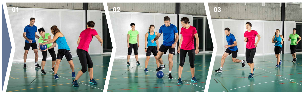
Spiele 01 Spiel 1 02 Spiel 2 03 Spiel 3