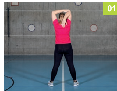
01 BE.07.OE Trizepsdehnung