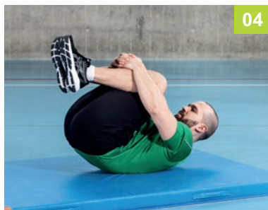
04 BE.02.RU Päcklirolle