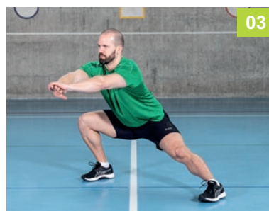
03 BE.05.UE Adduktorendehnung stehend