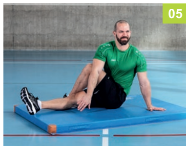
05 BE.06.RU Twist sitzend