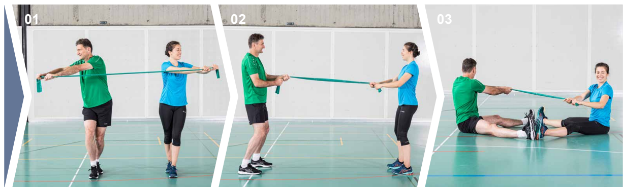
Übungen 01 Übung 1 02 Übung 2 03 Übung 3