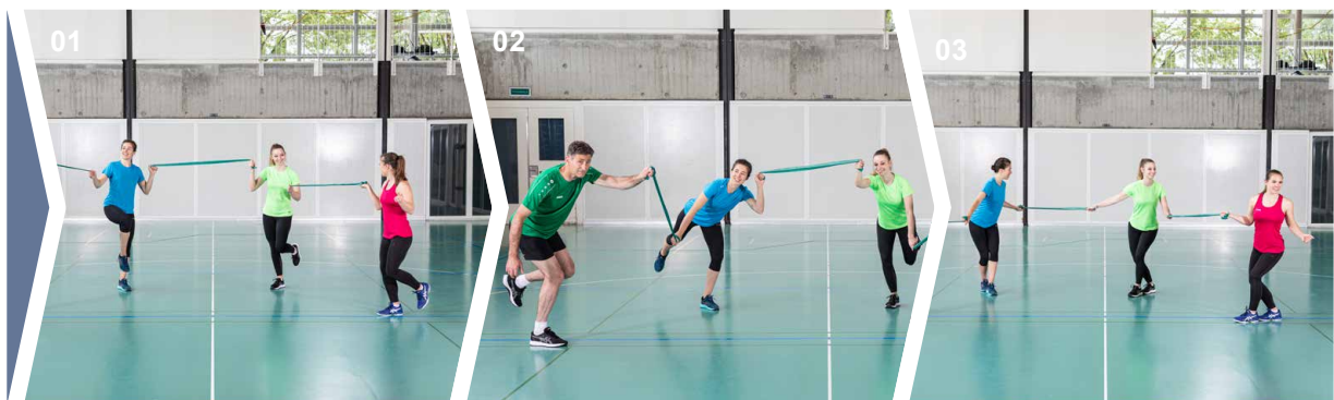
Übungen 01 Übung 1 02 Übung 2 03 Übung 3