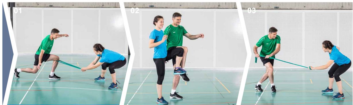
Übungen 01 Übung 1 02 Übung 2 03 Übung 3