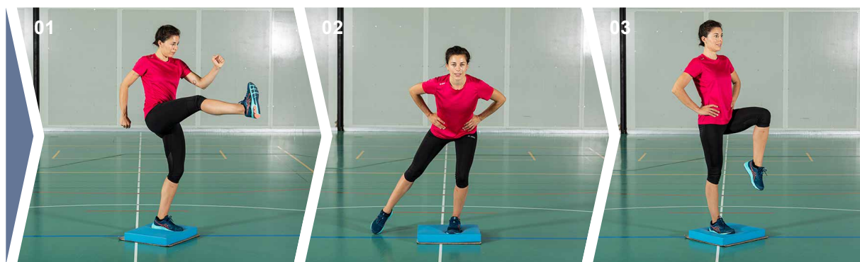
Exercices 01 Exercice 1 02 Exercice 2 03 Exercice 3