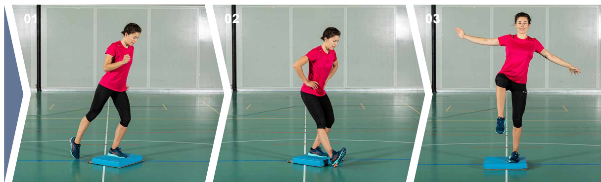
Exercices 01 Exercice 1 02 Exercice 2 03 Exercice 3