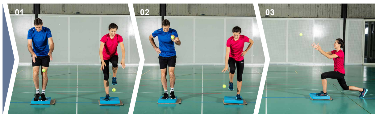
Exercices 01 Exercice 1 02 Exercice 2 03 Exercice 3