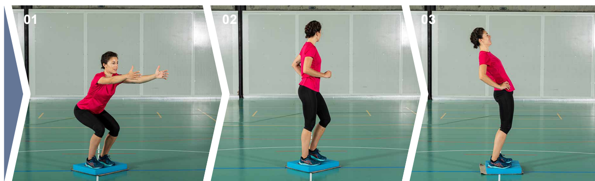
Exercices 01 Exercice 1 02 Exercice 2 03 Exercice 3