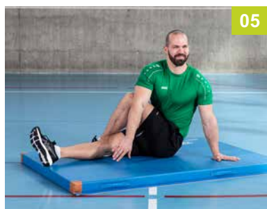
SO.06.TR Twist assis