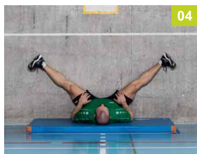
SO.06.EI Etirement des adducteurs en position couchée