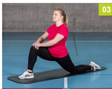
SO.07.EI Etirement du bassin en position à genoux