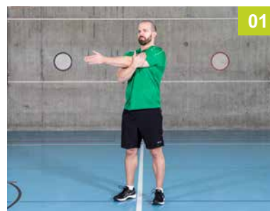
SO.02.ES Etirement des épaules en position debout