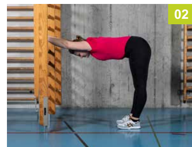
SO.01.ES Etirement des épaules aux espaliers