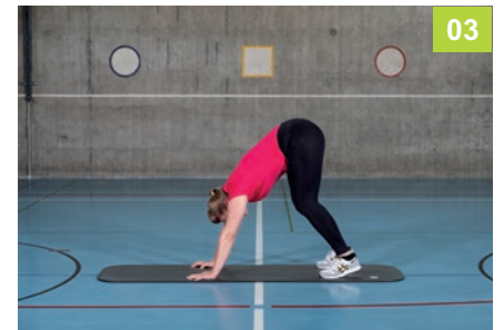
3 Oberkörper abrollen, mit den Händen nach vorne laufen und Schultern dehnen. Beine gestreckt oder gebeugt