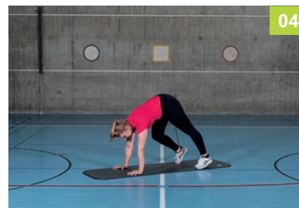
4 Beine abwechselnd beugen