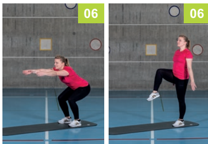
6 Kniebeuge und Knie hoch rechts, Kniebeuge und Knie hoch links