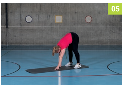
5 Zurücklaufen und aufrollen zum Stand