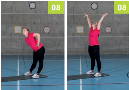
8 Hüftkreisen rechts/links und danach nochmals eine Körperstreckung

Mobilisierende Bewegungsabfolge zum Aufwärmen oder als Bewegungspause. Wiederholt die Abfolge, bis ihr euch aufgewärmt fühlt. Als Richtwert sind etwa 10 bis 15 Minuten Zeit einzuberechnen.